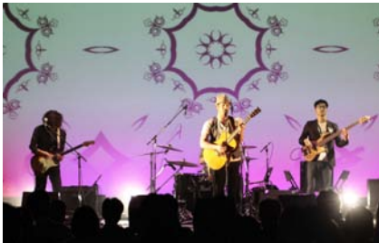
[コンサート] nothing ever lasts