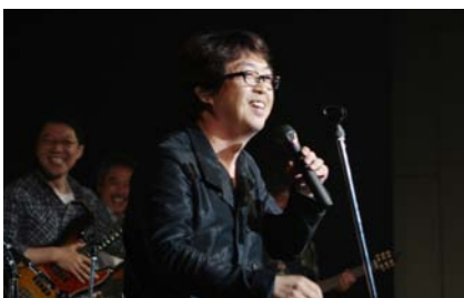
[コンサート] XQ' s