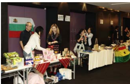
[ホワイエ] 国際バザール／東北地方の物産展